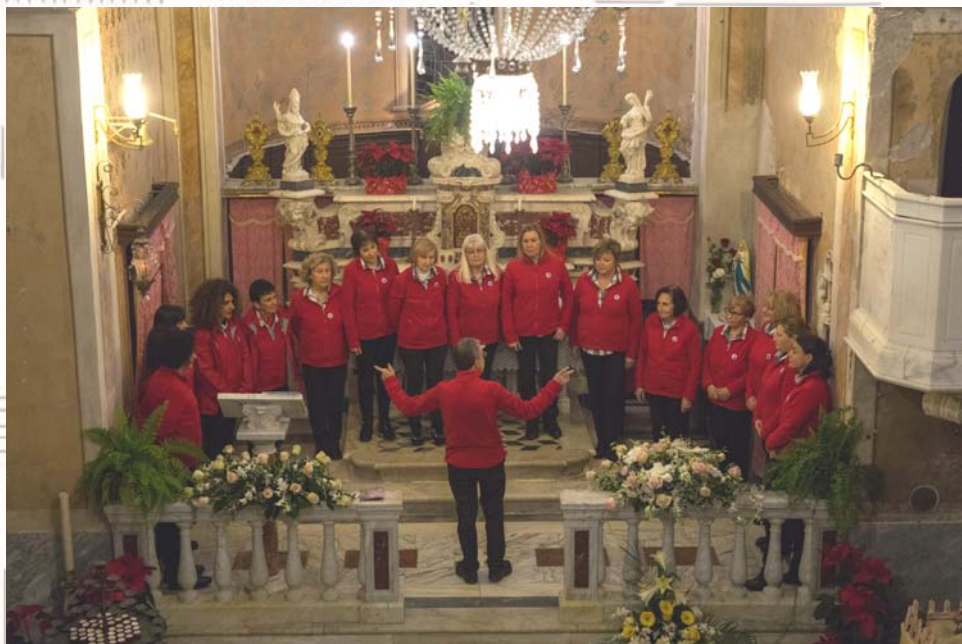
CORO ROSA DELLE APUANE (MS)